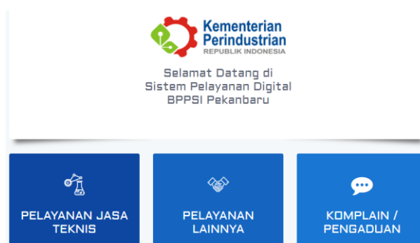
Sistem Pelayanan Informasi Publik (SIPELIK)

Sistem Pelayanan Informasi Publik (SIPELIK) merupakan salah satu inovasi layanan informasi di tahun 2021. Sistem Pelayanan Informasi Publik (SIPELIK) memiliki fitur berupa pengajuan layanan jasa teknis maupun non teknis dan pengajuan komplain serta pengaduan. Disediakan saluran pengajuan yang berbasis internet tersebut sejalan dengan pergeseran pola komunikasi publik yang menuju digital.