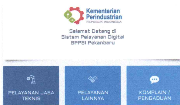
Sistem Pelayanan Informasi Publik (SIPELIK)

Sistem Pelayanan Informasi Publik (SIPELIK) merupakan salah satu inovasi layanan informasi di tahun 2022. Sistem Pelayanan Informasi Publik (SIPELIK) memiliki fitur berupa pengajuan layanan jasa teknis maupun non teknis dan pengajuan komplain serta pengaduan. Disediakan saluran pengajuan yang berbasis internet tersebut sejalan dengan pergeseran pola komunikasi publik yang menuju digital.