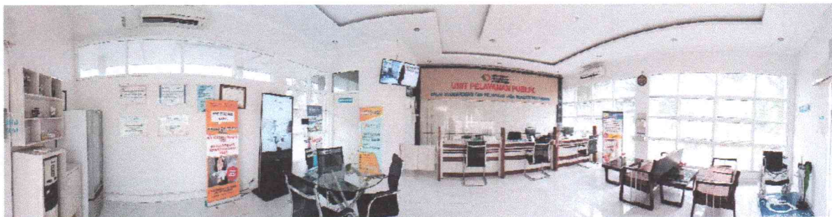
Unit Pelayanan Publik

Dalam rangka mempublikasikan seluruh informasi mengenai pelaksanaan tugas dan fungsinya, PPID BSPJI Pekanbaru telah memutakhirkan konten pada menu informasi publik yang ada di website BSPJI Pekanbaru.