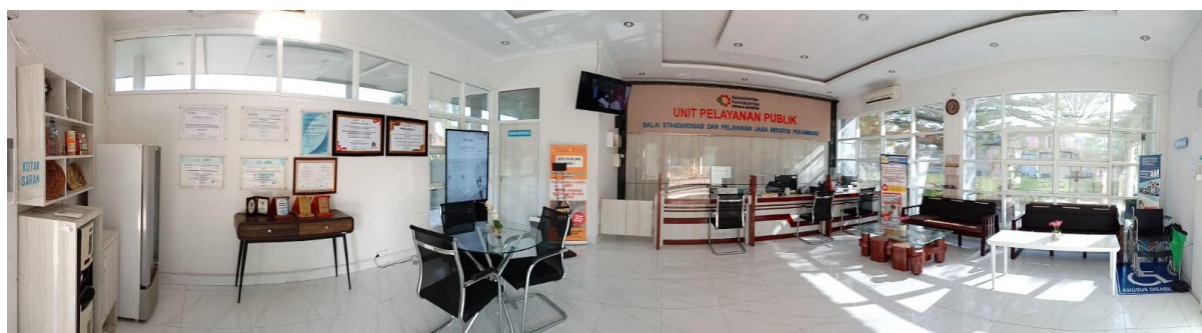
Unit Pelayanan Publik

Dalam rangka mempublikasikan seluruh informasi mengenai pelaksanaan tugas dan fungsinya, PPID BSPJI Pekanbaru telah memutakhirkan konten pada menu informasi publik yang ada di website BSPJI Pekanbaru.